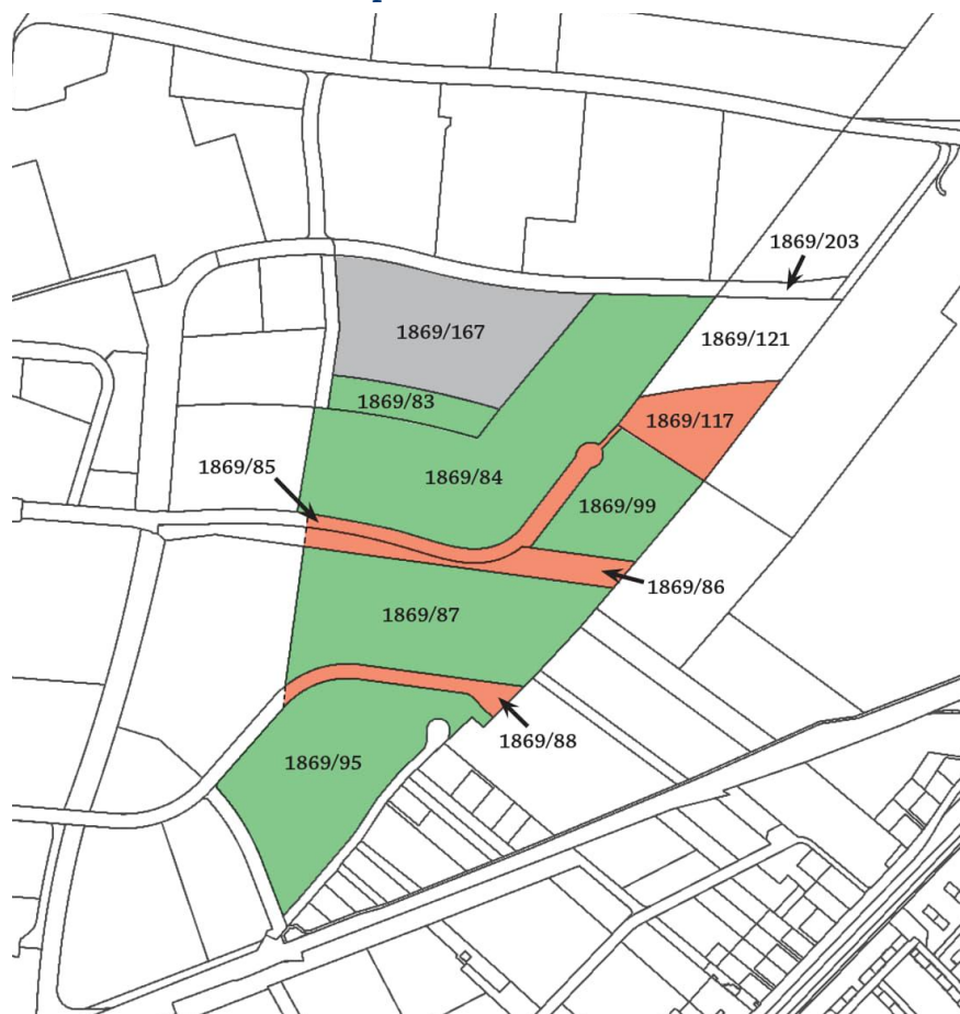
Abbildung 3: Lageplan Planungsgebiet zum Beschluss NÖ Landtag vom 11. April 2019