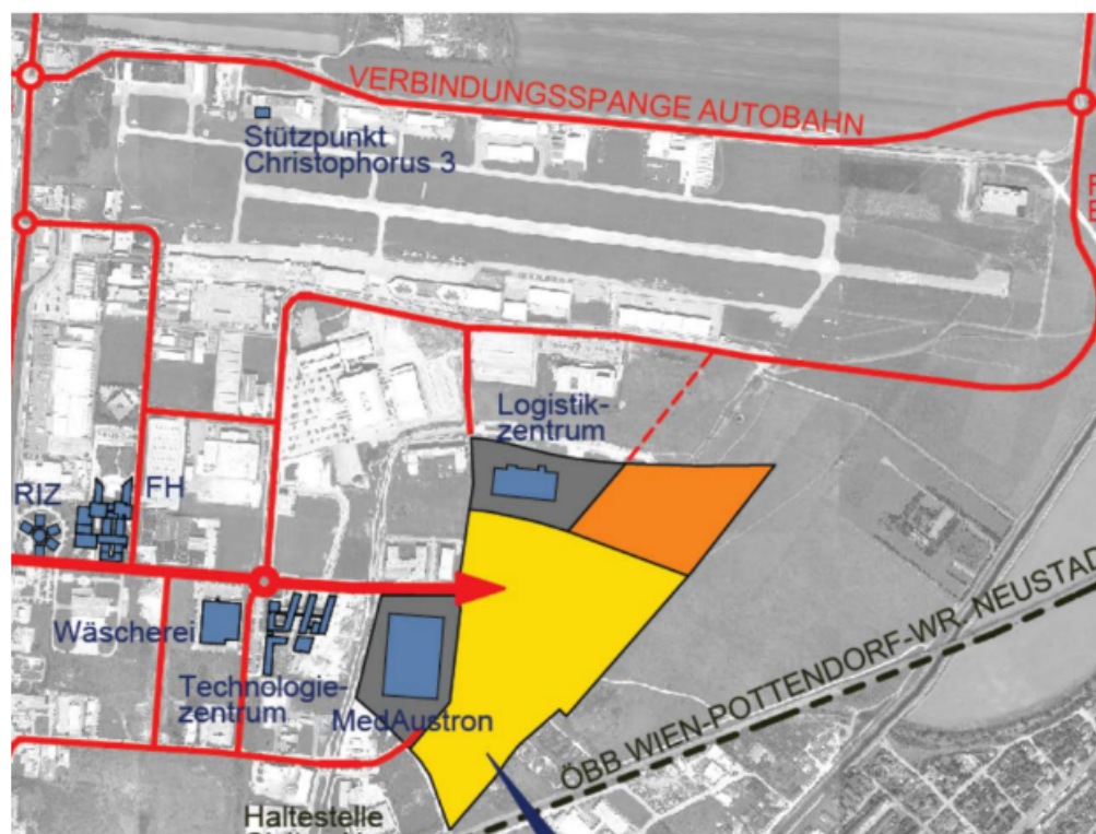
Abbildung 1: Lageplan zur Projektentwicklung

Quelle: Technische Beilage zur Vorlage an den NÖ Landtag „Landeskrankenhaus Wiener Neustadt, Gesamtausbau – Neubau des Krankenhauses – Projektentwicklung“ vom 9. Dezember 2014